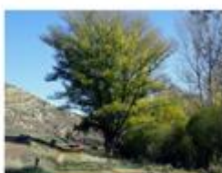
Aguilar del Alfambra, Aragón, Španělsko Topol černý v Alfambře 13951 hlasů

Zde jsou pravidla hlasování, které budou také viset na webu: