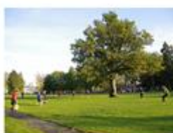
Orissaare, Saaremaa, Estonsko Dub na fotbalovém hřišti 56836 hlasů

3. Rolováním myši na úvodní stránce se dostanete na profily stromů.