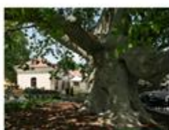
Tata, župa Komárom-Esztergom, Maďarsko Velký platan v Tatě 53487 hlasů